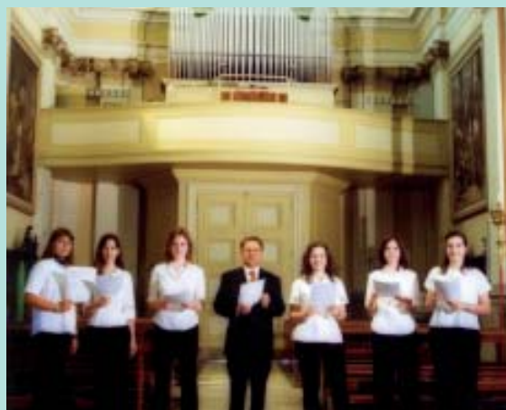
Juvenes Cantores "Euterpe" di Gradisca di Sedegliano (UD)