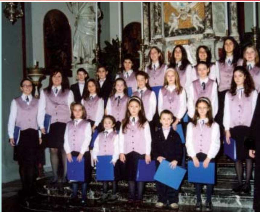
Pueri Cantores "Santa Maria Assunta" di Martignacco (UD)