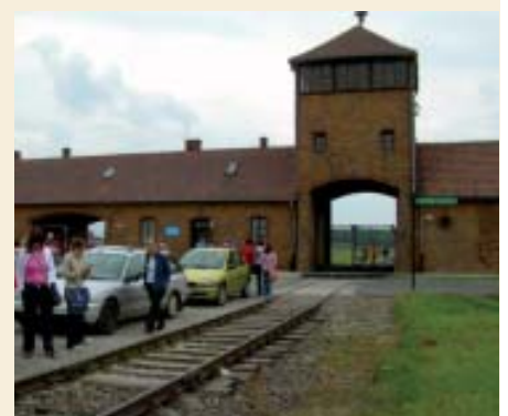
Entrata di Auschwitz-Birkenau

Torniamo in pullman sicuramente diversi rispetto a prima, pochi viaggi e pochi luoghi riescono a cambiarci la vita: Auschwitz è sicuramente uno di questi.