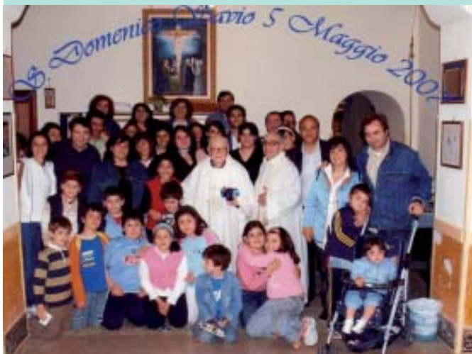
Pueri et Juvenes Cantores "S.Michele Arcangelo" di Piano di Sorrento (Na)