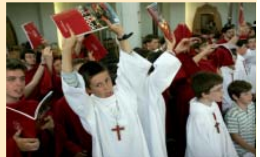
La "ola" alla fine della Messa