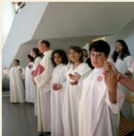
13 luglio 2007 ore 18.30 L'altare della Basilica della Misericordia, mentre si celebra la Cerimonia della Pace

la splendida "Dama con l'ermellino" di Leonardo da Vinci e anche, pensate un po', il pianoforte di Chopin.