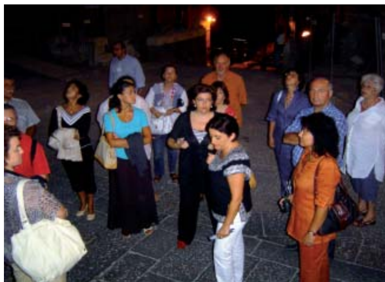
A spasso per Cagliari