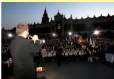
Cerimonia di Apertura: rievocazione storica del sacrificio del Trombettiere