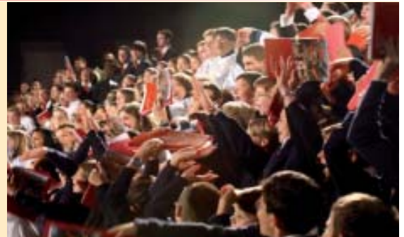
La "ola" al Concerto di Gala