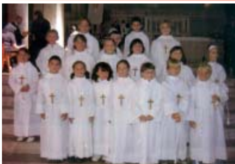
Pueri Cantores "Voltabarozzo" Padova