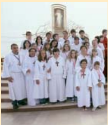
Pueri e Juvenes di Monte San Giusto