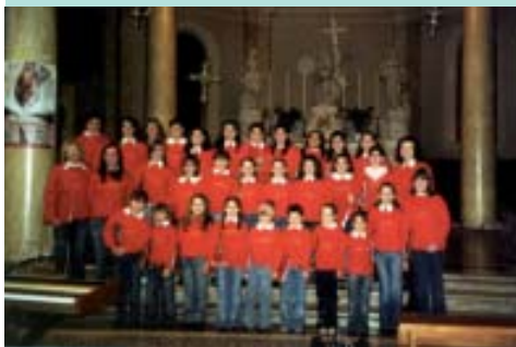
Pueri Cantores "Note Dorate" di Cinto Caomaggiore (VE)