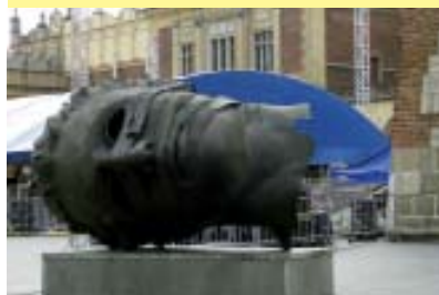
Monumento in Piazza Grande a Cracovia