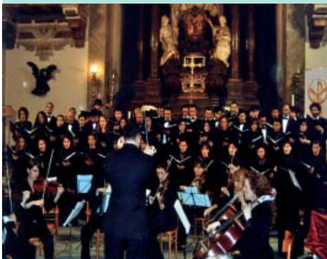
Juvenes Cantores "Poliphonica" di Pisa