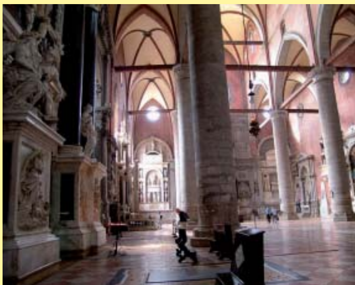
Venezia: l'interno della Basilica dei Santi Giovanni e Paolo.

Ricordo che i Vigili Urbani di Venezia, hanno decretato il divieto di fare pic-nic o bivaccare per calli e campielli. Sono previste multe per chi fa pranzo per strada.