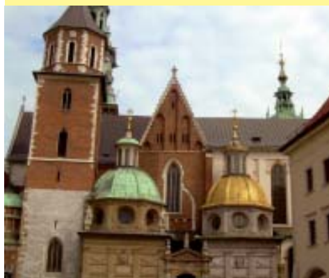
Chiesa Santa Maria di Cracovia