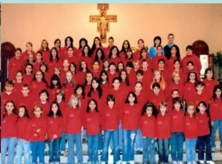
Pueri Cantores "Piccolo Coro Sclavons" di Cordenons (PN)