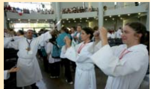
La "ola" di Rossano