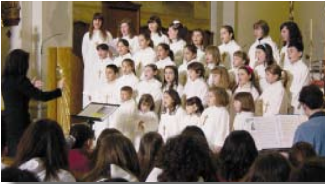
a sinistra Pueri Cantores “vos di Muzzana del Turgnano, a destra Pueri “Jubilate” di Zellina di S. Giorgio di Nogaro