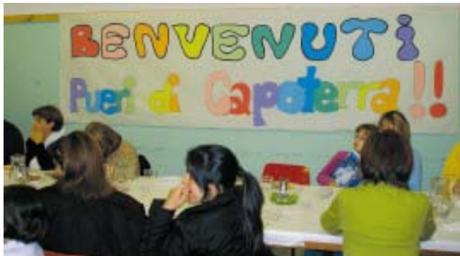
Calda accoglienza a tavola!!