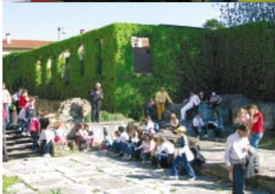
Visita agli scavi romani di Concordia Sagittaria..