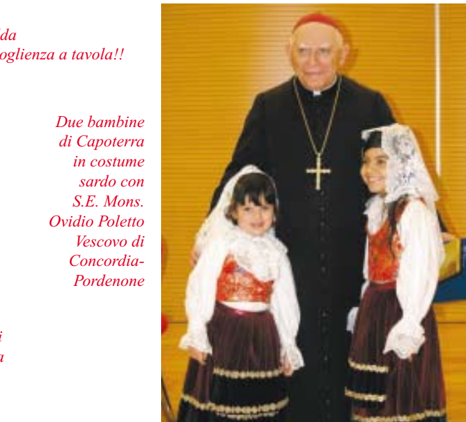
Due bambine di Capoterra in costume sardo con S.E. Mons. Ovidio Poletto Vescovo di Concordia-Pordenone