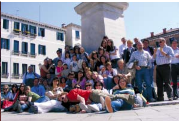
Pueri Cantores "Adrara San Martino" di Adrara San Martino (BG), nella Piazza Grande di Palmanova