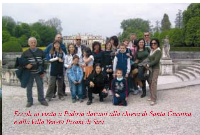
Eccoli in visita a Padova davanti alla chiesa di Santa Giustina e alla Villa Veneta Pisani di Stra