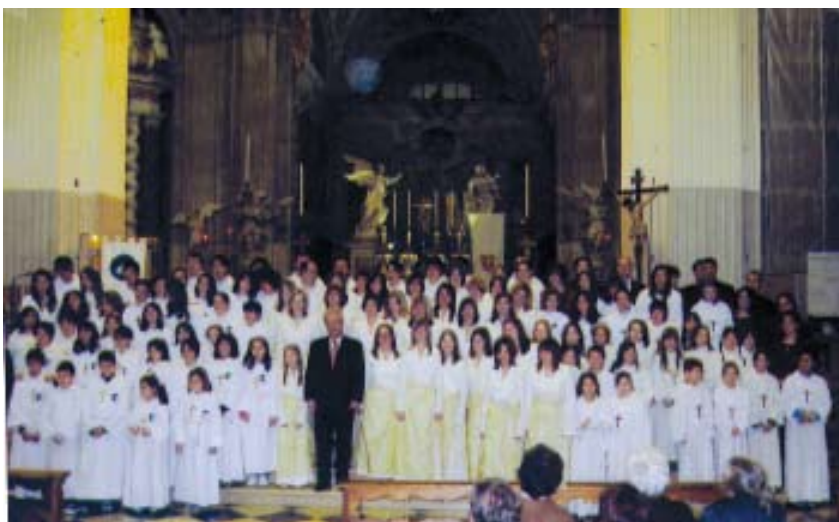
Pueri Cantores di Roma, Macerata, Tolmino e Udine in Concerto nel Duomo a Udine.

Alla sera, sempre nella Cattedrale di Udine, i gruppi di Pueri e Juvenes Cantores di Tolmino, Macerata e di Udine hanno animato con il canto la Messa prefestiva delle ore 19 ed hanno concluso il loro incontro con un concerto di musica sacra .