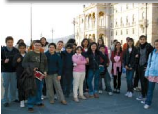
Da sinistra a destra: I Pueri Cantores “Cantarè” accolgono i loro amici con dei cartelli di benvenuto alla stazione di Trieste. “Jonia Pueri” e “Cantarè” in piazza Unità d'Italia, ancora in piazza Unità d'Italia, davanti a San Giusto, “Jonia Pueri” in Concerto. Nell'ultima a destra, “Jonia Pueri” e “Cantarè” cantano insieme in allegria