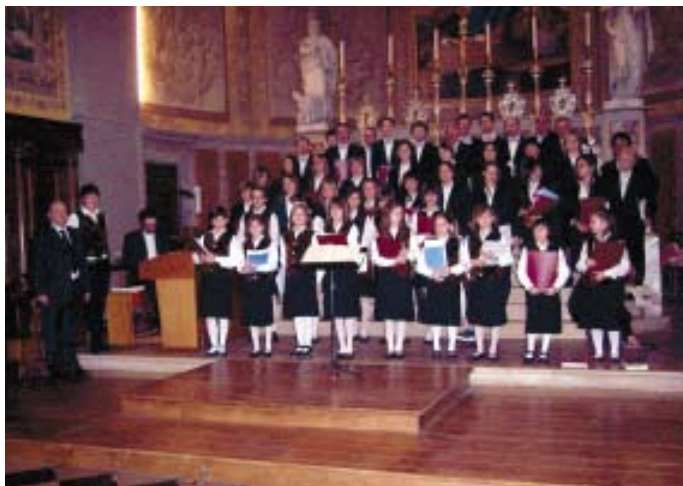
Pueri Cantores "Adrara San Martino" di Adrara San Martino (BG), in Concerto a Palmanova