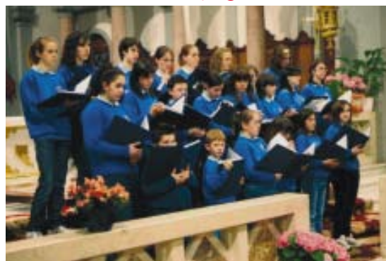
“Pueri Cantores” “In Dulci Jubilo” di Fagagna