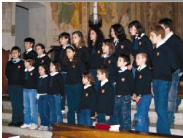
A sinistra i Pueri “San Nicolò e Santa Lucia” di Pisa, a destra “Le Voci Bianche di don Bosco” di Naro in Concerto nel Duomo di Spilimbergo