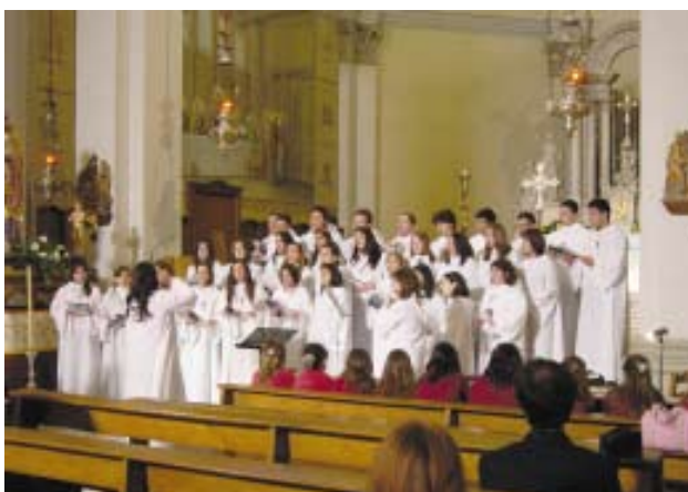
A sinistra Pueri Cantores "don Antonio Izzo" di Sorrento, a destra Pueri Cantores "San Giuseppe" di Castions di Strada

Il 26 sera aprile Rassegna a Castions di Strada : i Pueri "San Giuseppe", "don A. Izzo" di Sorrento, "Vos di Muzzane" di Muzzana del Turgnano, "Santa Maria del Rosario" di Flambruzzo, "Jubilate" di Zellina.