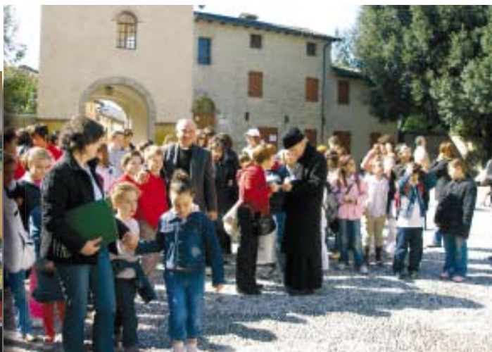
Le Rondinelle con gli ospiti in Visita all’Abbazia di Sesto al Reghena, Auditorium di Sesto al Reghena e festa con il Vescovo che parla a tutti i cori della Diocesi di Pordenone e ai cori ospiti.