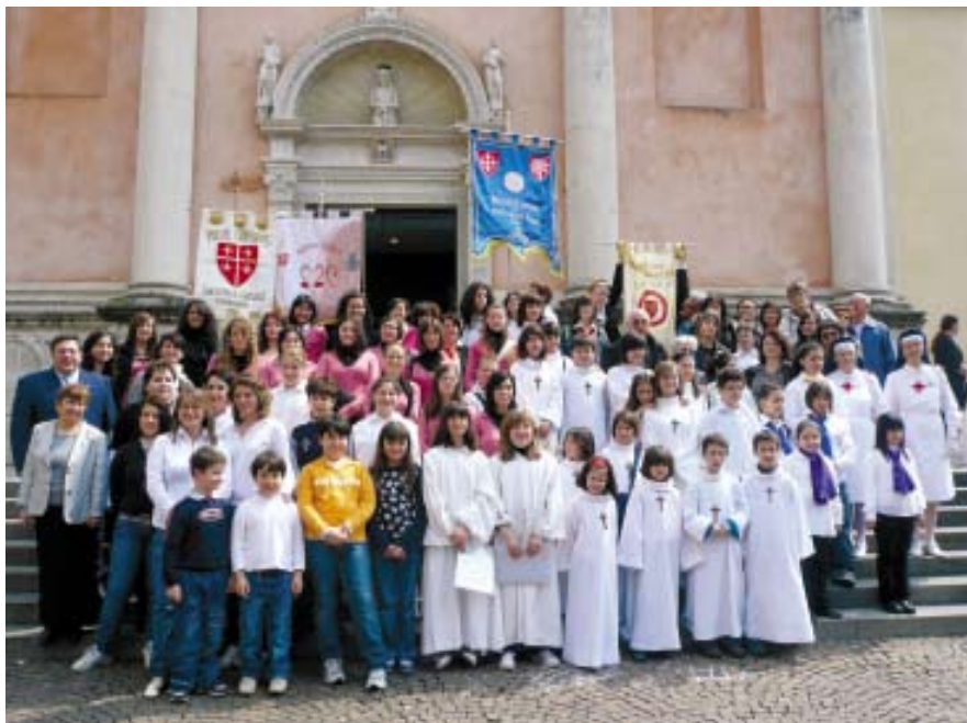
Messa il 25 aprile - Duomo Concattedrale San Marco a Pordenone per la festa del Patrono. Pueri di Pordenone, Cordenons, Vittorio Veneto, Naro e Pisa

Hanno partecipato i Pueri Cantores “San Giovanna D’Arco” di Cordenons diretti da Patrizia Avon