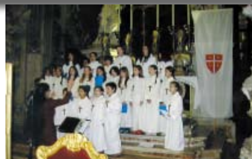
A destra i Pueri Cantores del Duomo di Udine.