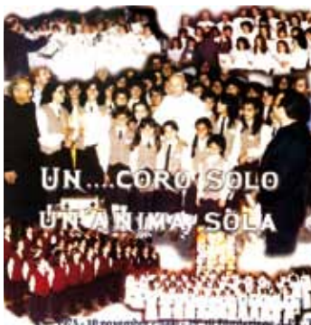
copertina del disco inciso nel 1975 “Un coro solo, un’anima sola”