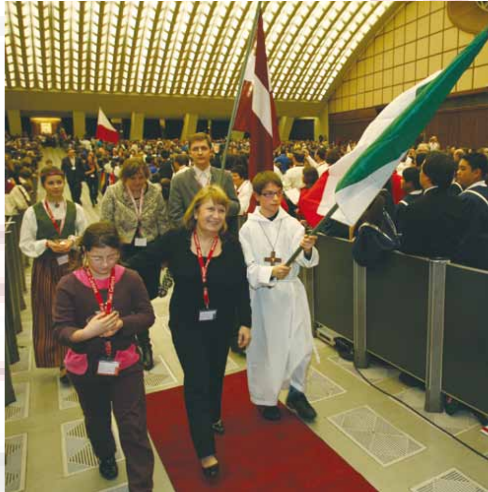
28 dicembre 2010 Sala Nervi Roma Cerimonia di apertura, entrata della bandiera italiana

Le reliquie vengono portate da un rappresentante dei Pueri Cantores mentre si canta "Ubi Caritas est"