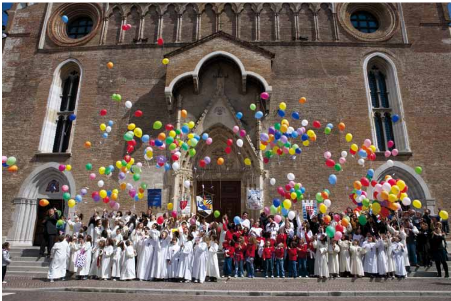
I Pueri Cantores di Udine, Fagagna, Bertiolo, Martignacco e Pordenone alla conclusione della Messa

Nella settimana di Pasqua 2010 si sono concluse le celebrazioni del 30° di fondazione dei Pueri Cantores del Duomo di Udine (1980-2010) con due iniziative legate alla Liturgia: