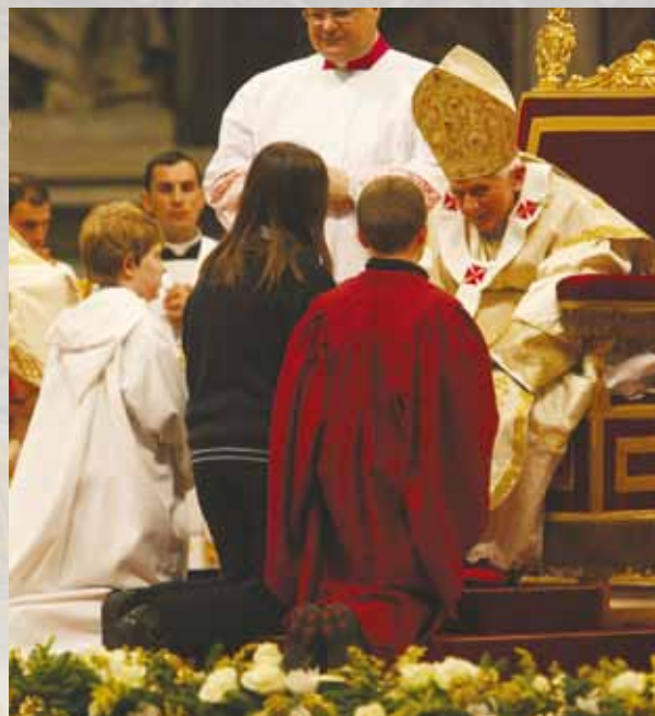
Messa 1° gennaio Processione offertoriale, Pueri di tre diverse nazioni portano i doni a Papa Benedetto XVI