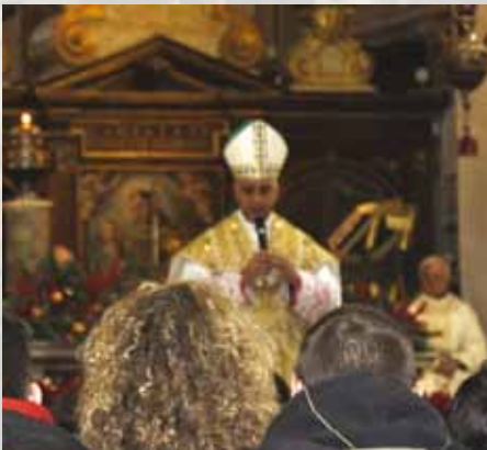
Mons. Rino Fisichella