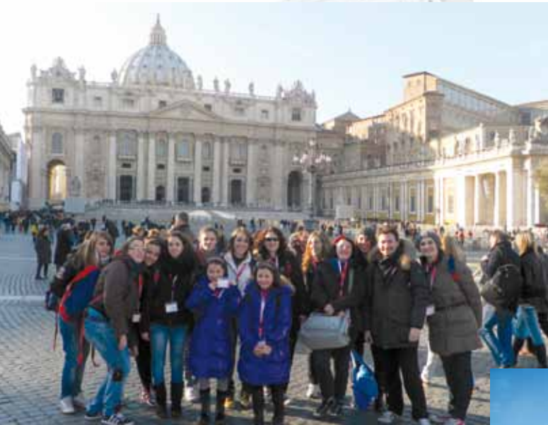
Pueri Cantores In Dulci Jubilo Di Fagagna